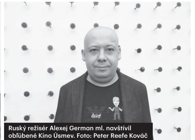
Ruský režisér Alexej German ml. navštívil obľúbené Kino Úsmev.