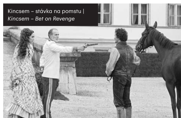
Kincsem – stávka na pomstu | Kincsem – Bet on Revenge