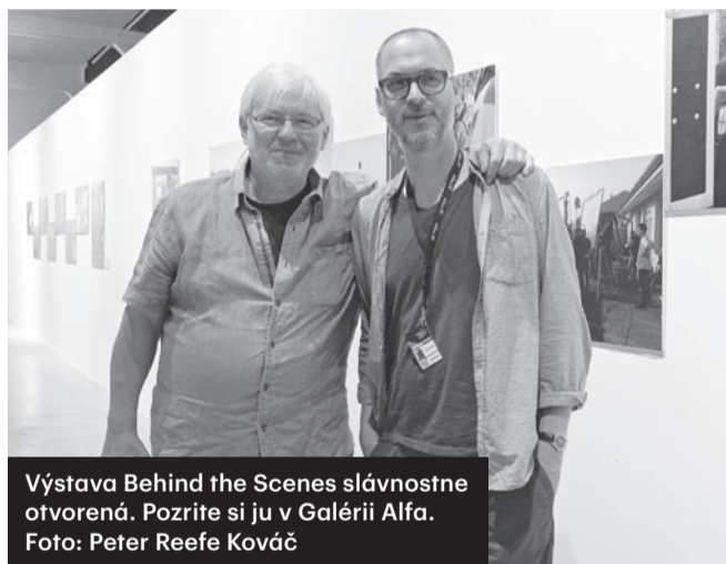
Výstava Behind the Scenes slávnostne otvorená. Pozrite si ju v Galérii Alfa.