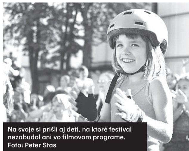
Na svoje si prišli aj deti, na ktoré festival nezabudol ani vo filmovom programe.