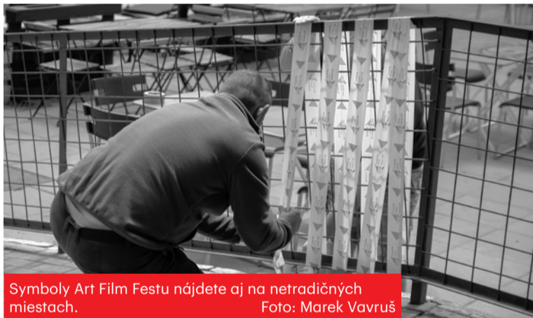
Symbols Art Film Festu nájdete aj na netradičných miestach.