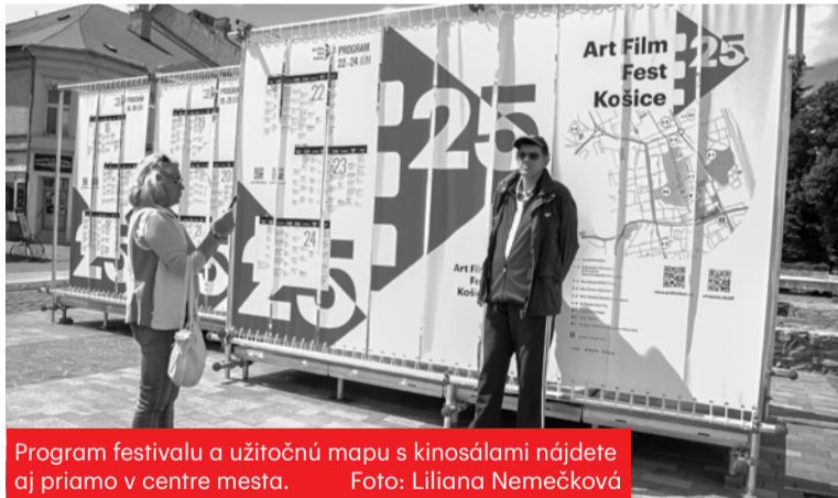
Program festivalu a užitočnú mapu s kinosálami nájdete aj priamo v centre mesta.