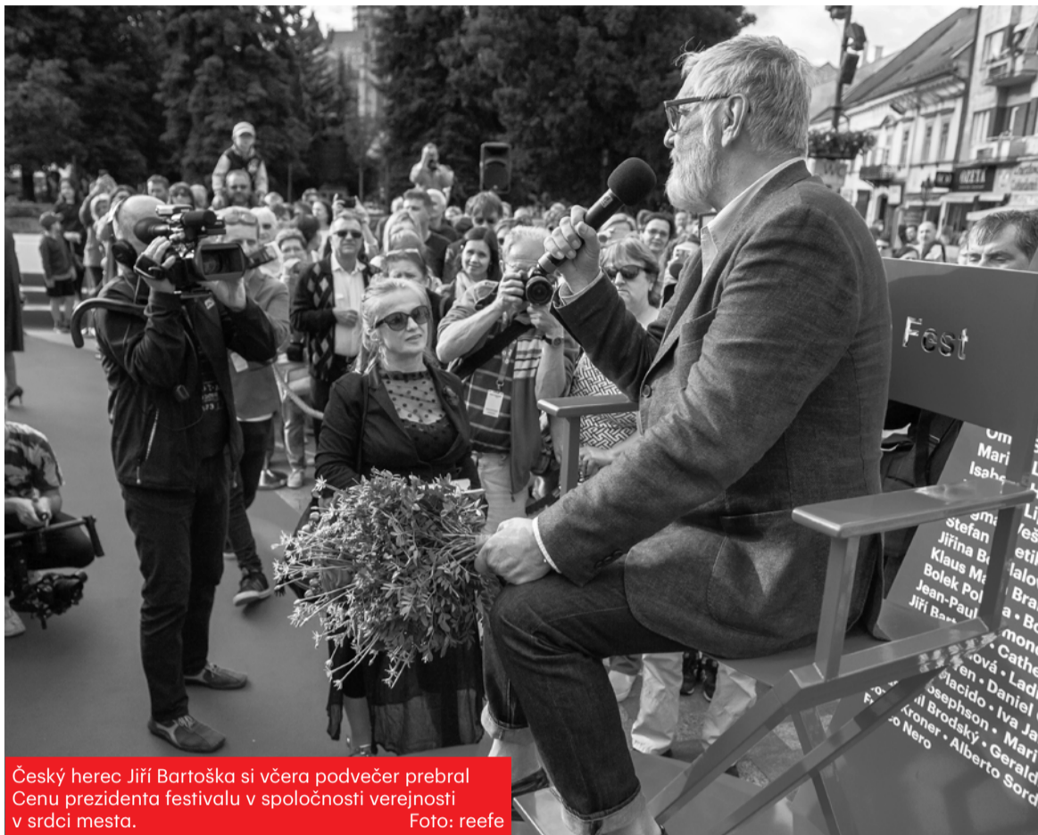
Český herec Jiří Bartoška si včera podvečer prebral Cenu prezidenta festivalu v spoločnosti verejnosti v srdci mesta.