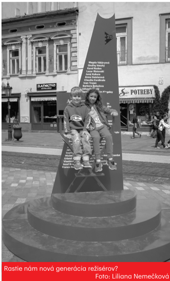
Rastie nám nová generácia režisérův?