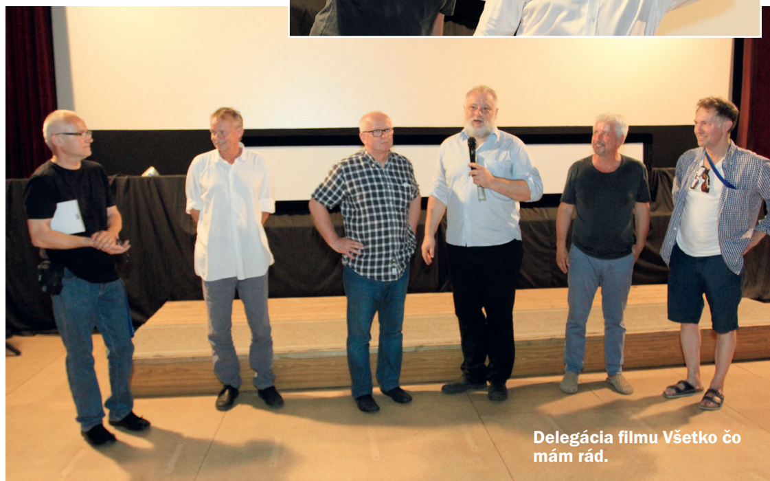
Delegácia filmu Všetko čo mám rád .