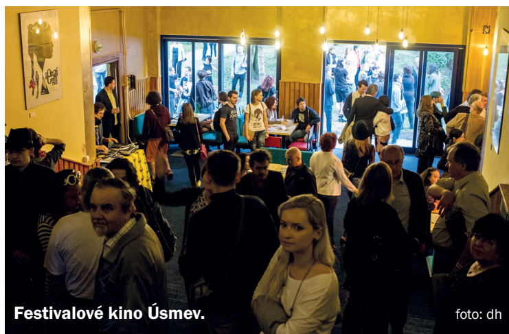
Festivalové kino Úsmev.