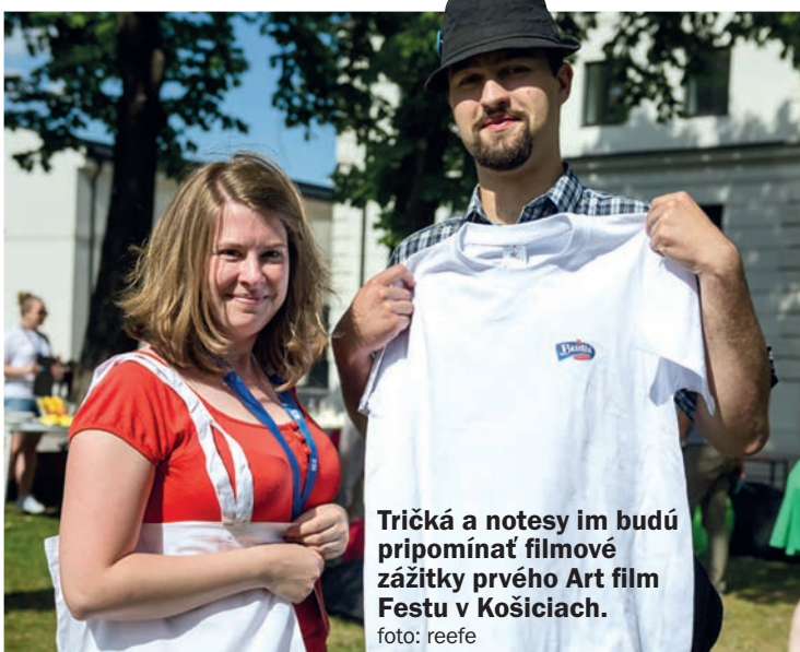
Tričká a notesy im budú pripomínať filmové zážitky prvého Art film Festu v Košiciach.