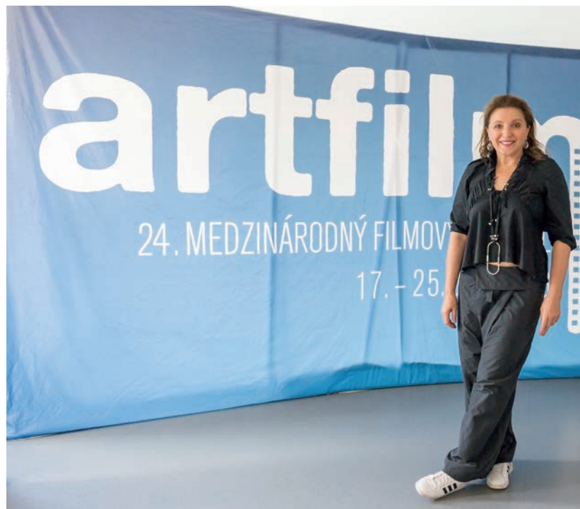
This isn't actress Mirjana Karanović's first time in Slovakia.

Most women in the Balkans tend to make decisions according to what their husbands decide. It gives them a feeling of security. Their husbands are their protectors. They accept their decisions, choosing to live life passively. That's what the title A Good