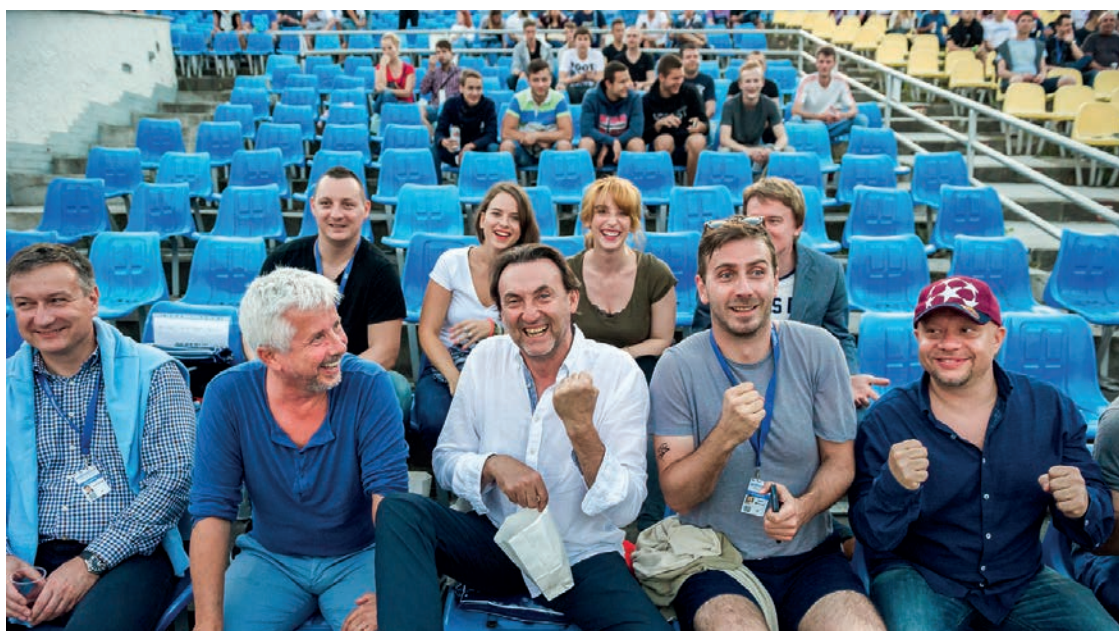
Povzbudzovali aj organizátori Art Film Festu spoločne s hercami.