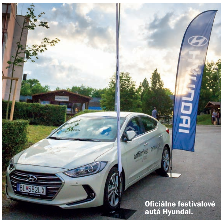
Oficiálne festivalové autá Hyundai.