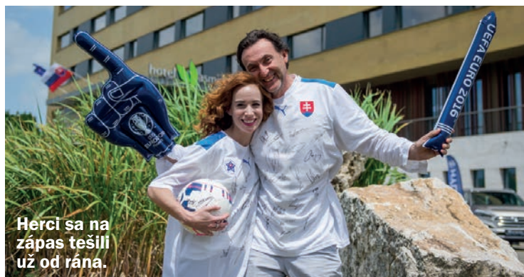
Herci sa na zápas tešili už od rána.