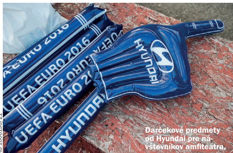
Darčkové predmety od Hyundai pre návštevníkov amfiteátra.