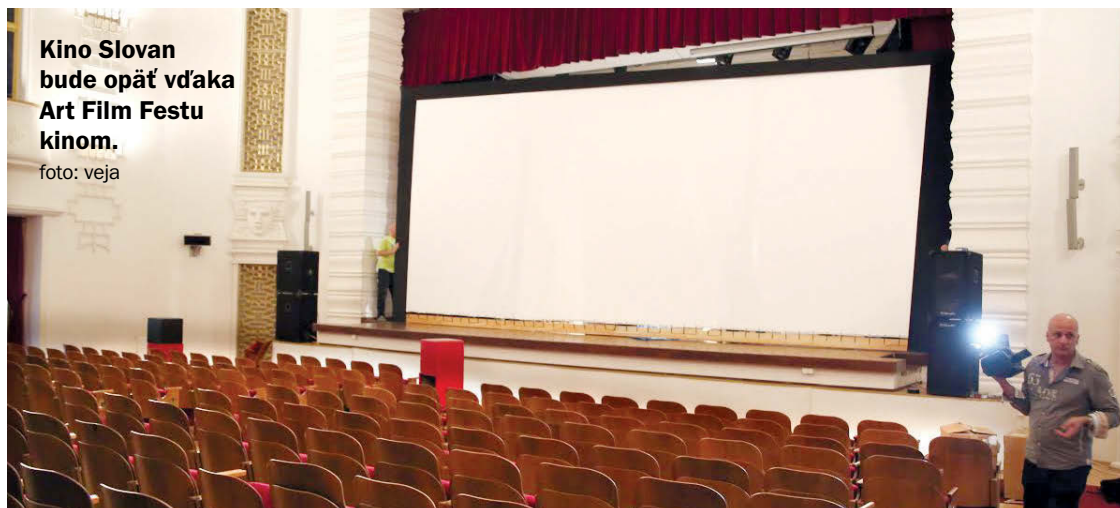
Kino Slovan bude opäť vďaka Art Film Festu kinom.

Jednou z unikátnych kinosál bude košická Historická radnica. Organizátori festivalu sa totiž rozhodli práve do niekdajšieho Kina Slovan, ktoré tu v minulosti sídlilo, umiestniť programovú sekciu filmov Európske zákutia. A bude mať aj špeciálne označenie. „Skupina JOJ vníma Art Film Fest ako prestížny medzinárodný filmový festival s bohatou históriou. Ako mediálny partner podujatia chceme, aby naša podpora bola nielen významná,