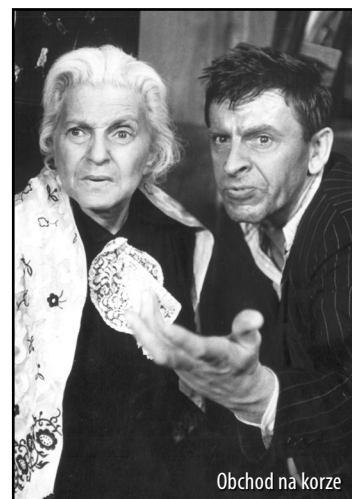
Obchod na korze