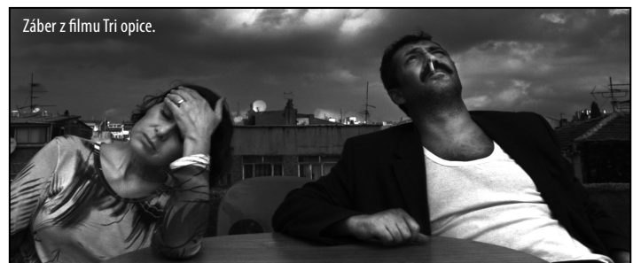
Záber z filmu Tri opice.