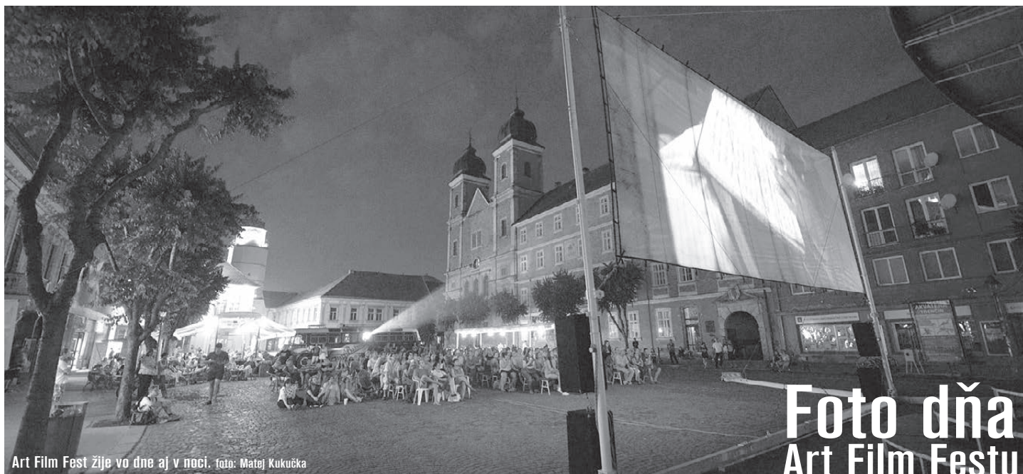
Art Film Fest žije vo dne aj v noci.