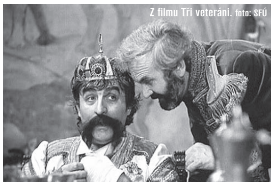
Z filmu Tři veteráni.