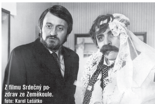
Z filmu Srdečný pozdrav ze Zeměkoule.