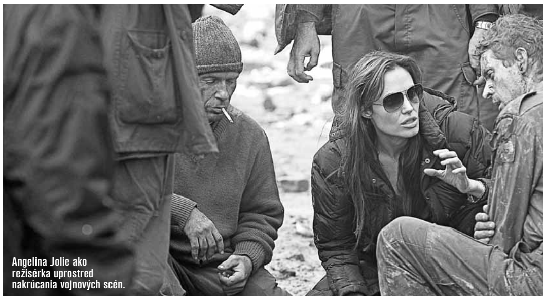
Angelina Jolie ako režisérka uprostred nakrúcania vojnových scén.

Kým ona si v 90. rokoch spokojne kráčala z hodín herectva po Los Angeles, iná mladá žena na druhom konci sveta utekala v streľbe samopalov na hodiny herectva. Hollywoodska hviezda Angelina Jolie mala priveľa otázok o vojne v Juhoslávii. A tak sa vybrala do Bosny, aby tam nakrútila film.