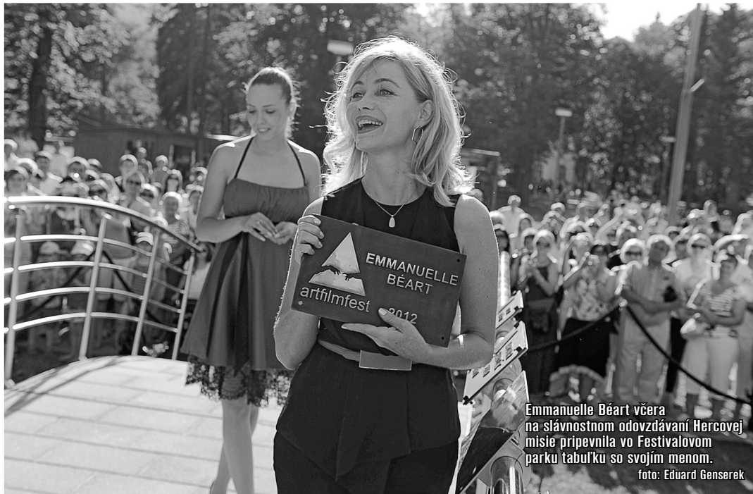
Emmanuelle Béart včera na slávnostnom odovzdávaní Hercovej misie pripevnila vo Festivalovom parku tabuľku so svojim menom.