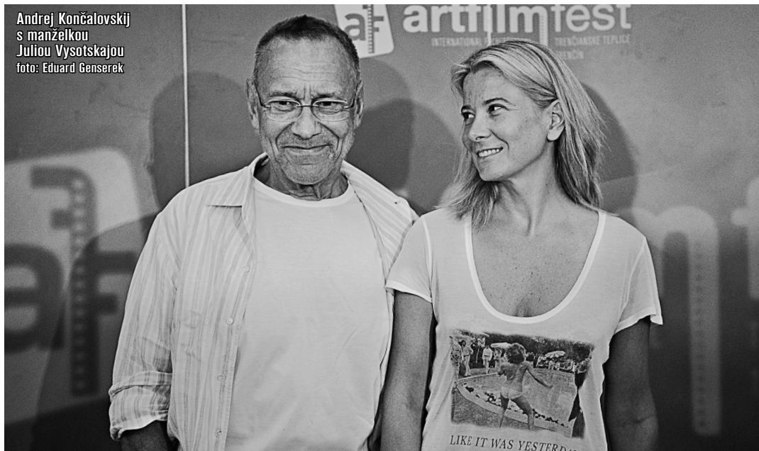
Andrej Končalovskij s manželkou Juliou Vysotskajou