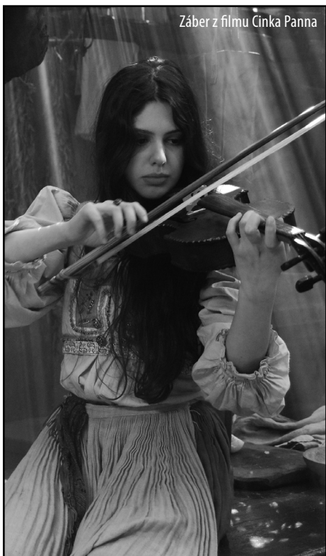
Záber z filmu Cinka Panna