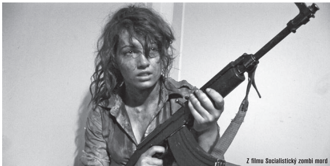
Z filmu Socialistický zombi mord