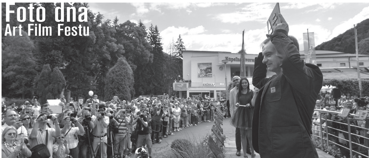
Ivan Trojan včera za potlesku stoviek fanúšikov a bleskov fotoaparátov pripevnil s vtipným divadielkom tabuľku so svojim menom vo Festivalovom parku.