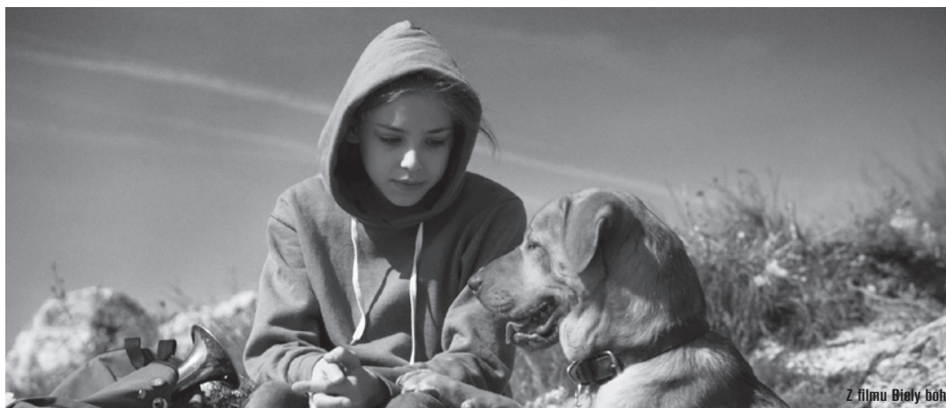
Z filmu Biely boh