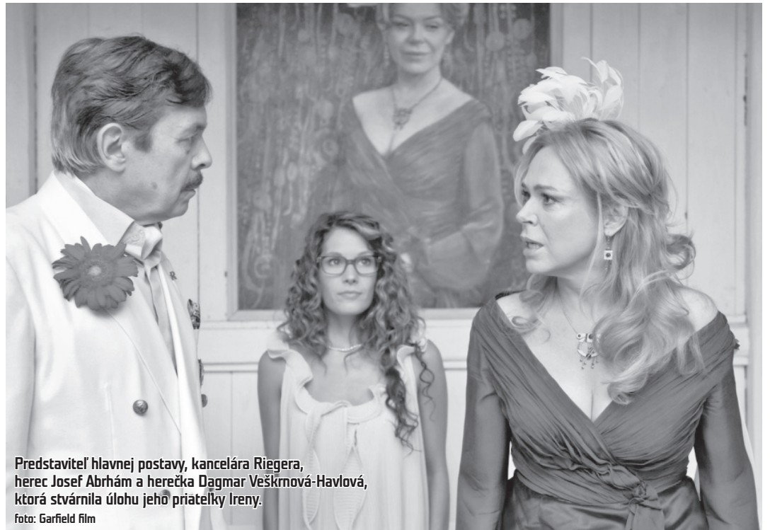
Predstavitel' hlavnej postavy, kancelára Riegera, herec Josef Abrhám a herečka Dagmar Veštkmrová-Havlová, ktorá stvárnila úlohu jeho priateľky Ireny.