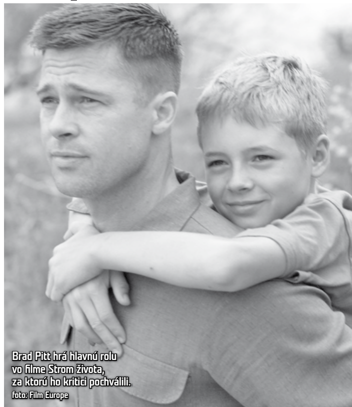
Brad Pitt hrá hlavnú rolu vo filme Strom života, za ktorú ho kritici pochválili.

Návštevníci Art Film Festu si budú môcť zajtra vychutnať aj víťazný výkon Kirsten Dunstovej, ktorá dostala cenu pre najlepšiu herečku vo filme Melanchólia kontroverzného dánskeho režiséra Larsa von Triera. Hoci bolo víťazstvo Kirsten Dunstovej na Lide skôr prekvapením, Trierova mystická snímka o zániku sveta patrila medzi favoritov na absolútneho víťaza od začiatku. Až kým si Lars von Trier nepripísal ako