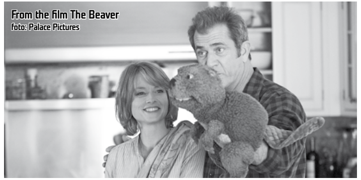
From the film The Beaver