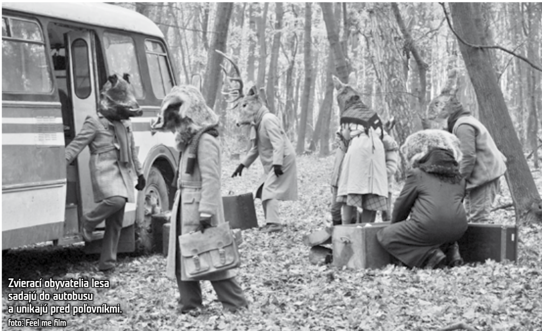
Zvierací obyvatelia lesa sadajú do autobusu a unikajú pred poľovníkmi.

Televízia JOJ uvedie Mafstory. Vtipné epizódy jockárskeho seriálu budú premietané dnes od 23.30 h do 7. h ráno v Kursalóne Kúpeľnej dvorany. Návštevníci Art Film Festu sa počas prvého víkendú mohli zabaviť na seriáli Profesionáli, teraz ich teda doplnia mafiánske historiky. (duš)