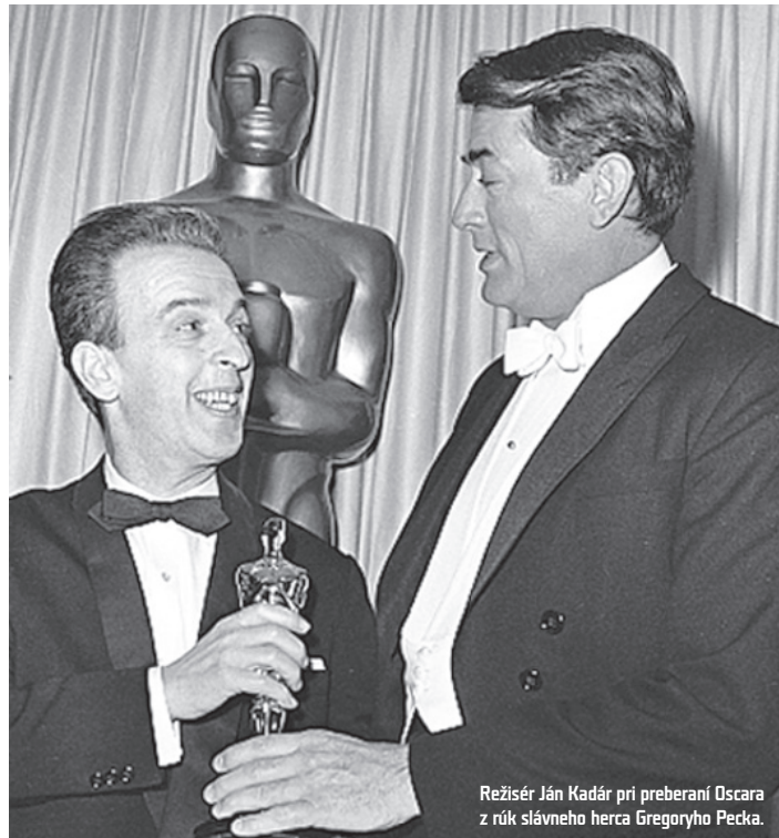
Režisér Ján Kadár pri preberaní Oscara z rúk slávneho herca Gregoryho Pecka.