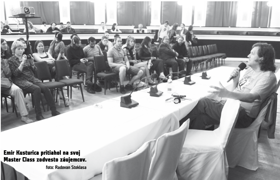
Emir Kusturica pritiahol na svoj Master Class zodvesto záujemcov.